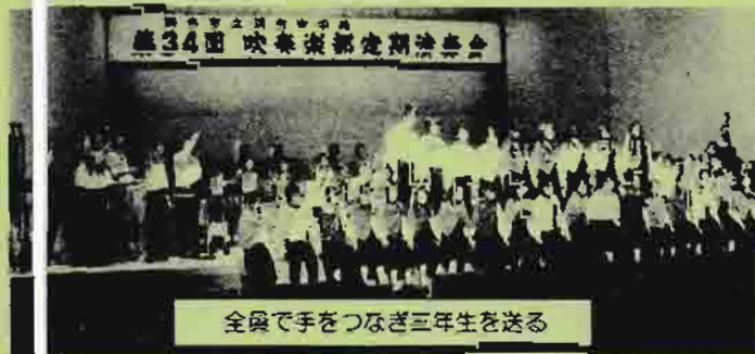
全員で手をつなぎ三年生を送る

3月27日(日)グリーンホール大ホールで開催されました。コンクールの金賞受賞曲から軽快なポップスまで、多彩な音色を楽しみました。