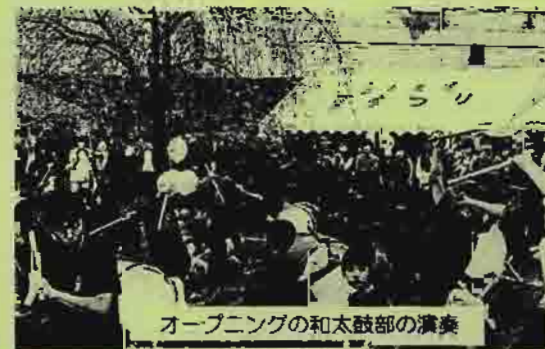
オープニングの和太鼓部の演奏

4月3日(日) 調布中学校にて、桜まつりが開催されました。学区域5小学校地区の健全育成など地域の団体のお店がたくさん出て、参加者は大いに盛り上がり、満開の桜を満喫しました。