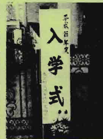
調布特別支援学校