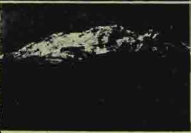
世界遺産にも登録されている、ポポカテペトル山(上)とイスタシワトル山(下)