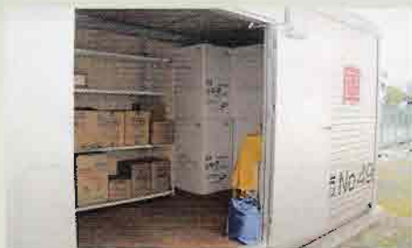
▲防災備蓄倉庫の開放・点検