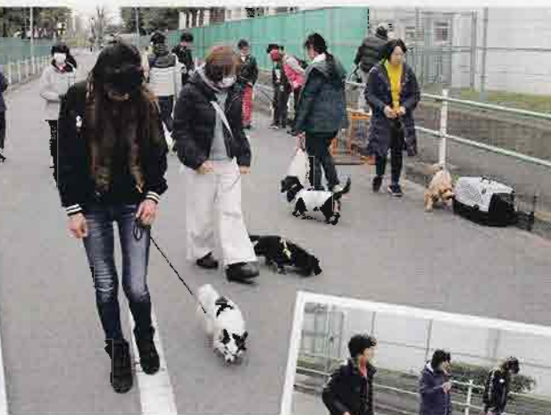
▲飼い主の横と一緒に歩く