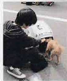
▲ケージに入る練習