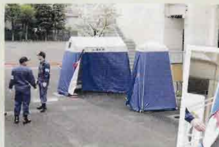
▲マンホールトイレ設営