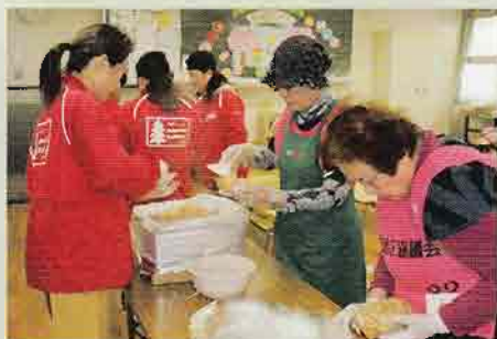
▲非常食アルファ米を900食用意