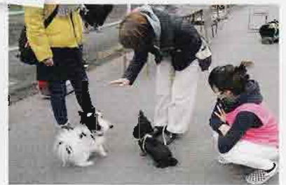
▲待ての指示で待ち続ける