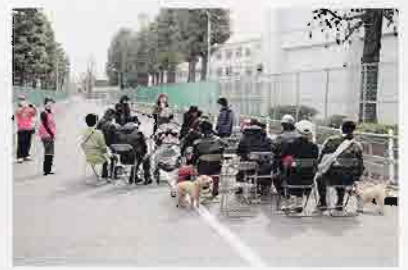
▲三中北側の道路で許可を取って行いました