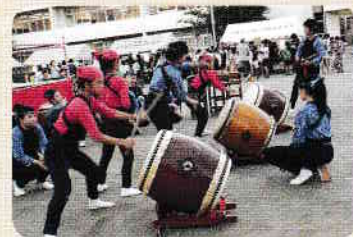
地域住民盆踊り大会