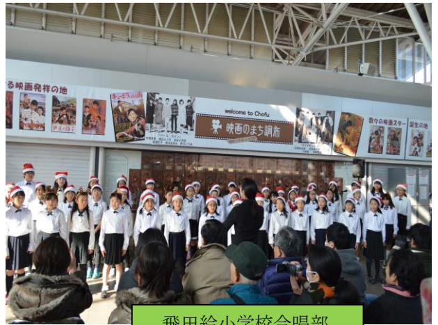
飛田給小学校合唱部

また点灯式はコンサートと時間をずらして16時30分に実施、点灯を見に来た親子にカウントダウンをお願いしました。動物や雪だるまなどのミニメントと天頂部からの電飾に明かりが灯ると、大きな歓声が湧き、記念撮影に訪れる方々が続きました。 スポーツプラザのイベントに訪れた人々にも感動を届けられたかと思えます。ご協力・ご賛同頂いた皆さん、出演して頂いた皆さん、そして参加いただいた地域の皆さんに改めて感謝致します。