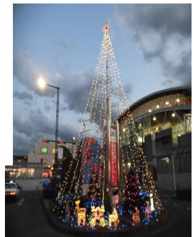
クリスマスツリー