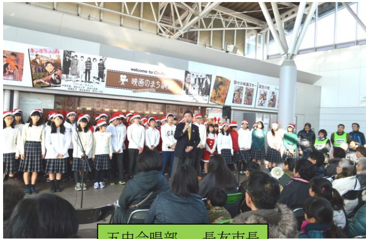
五中合唱部、長友市長