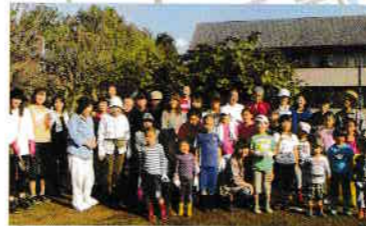
H.26年「10月25日 お芋掘り大会