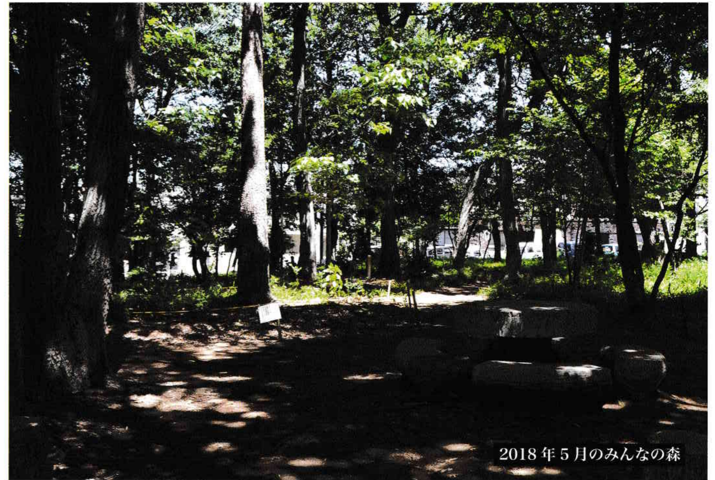
2018年5月のみんなの森

お問い合わせ(火 木 土 9時-5時) 緑ヶ丘コーナー 03-3326-4088