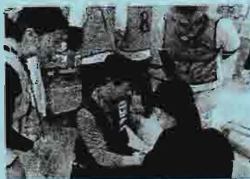
重症度によってラベルを色分けします

第一小学校地域では北多摩病院、東山病院、飯野病院になります。病院の軒先に救護施設を作り怪我の重さによって別の病院に運んだりする訓練です。