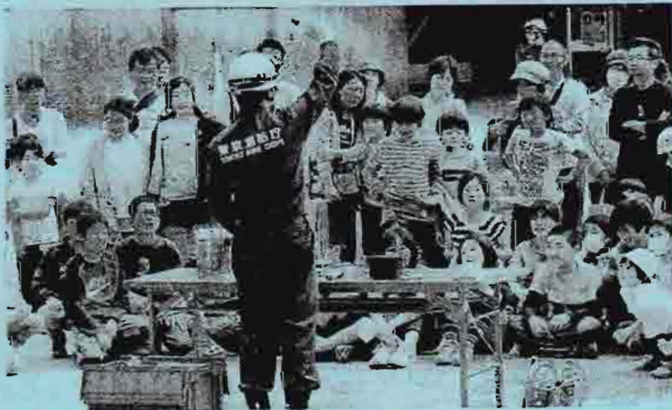
スプレー缶の引火の危険性を説明する消防署の職員

ご協力いただいたみなさま、ご参加をいただいた多くの児童や保護者のみなさまに、お礼申し上げます。