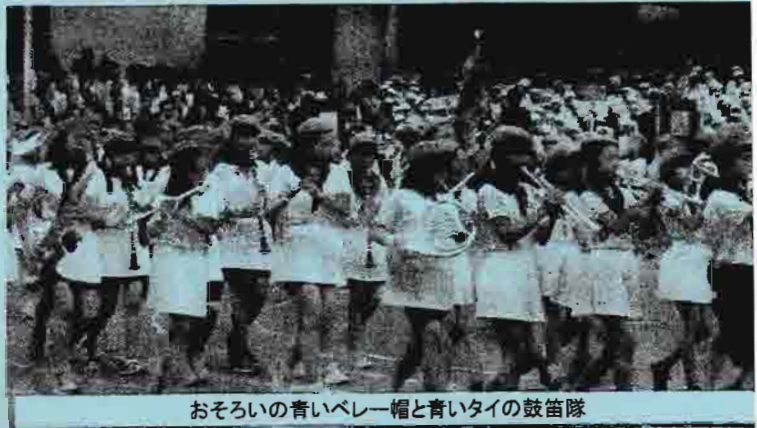
おそろいの青いベレー帽と青いタイの鼓笛隊

第一小学校の運動会が5月28日(土)晴天の中で行われました。6年生の鼓笛隊による入場行進は、第一小の伝統です。