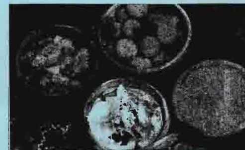
粘土の鍋に入った料理の数々

紅茶以外にスリランカの食べ物もとても人気です。スリランカの主食は米です。赤い米が良く使われています。スリランカの豊富な食材と新鮮な香辛料を多用したスパイシーな料理が多いです。ココナッツミルクが多く使われています。昔は粘土で作った鍋を使って薪を使って料理を作ったけれど、最近は金属の鍋とガスが多く使われます。今も特別な祭りなどの時は、粘土の鍋をよく使います。