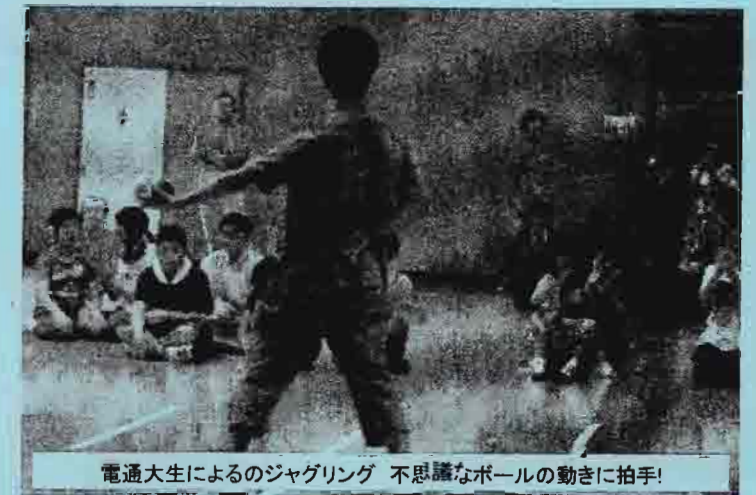
電通大生によるジャグリング 不思議なボールの動きに拍手!

特別支援学校と地域を結ぶ「放課後活動」開始! 特別支援学校を応援するリソースネットは6月25日(土)親子家族、先生、地域、サポーターと放課後活動「じゃんけんPON」遊びをしました。地域のグループのゲームやフラダンスや電通大学生のジャグリングを見たり体験をしました。なんんといってもお楽しみは、ぬいぐるみのどーもくん、ワンワンくんのじゃんけんでした。