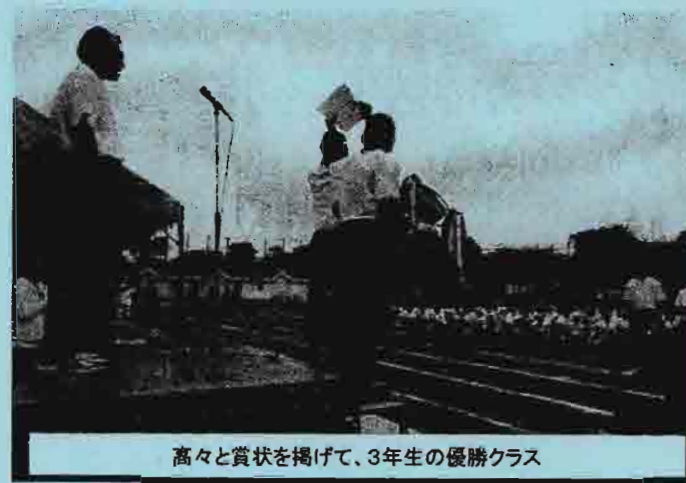
高々と賞状を掲げて、3年生の優勝クラス