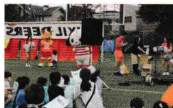
ファンフェスタ 抽選会

ガマルくんの登場や、ポッチャ、バスケなどアメフトに留まらない会場は熱気を帯びてました。