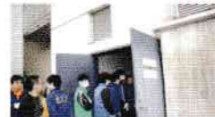
防災倉庫内点検と整理