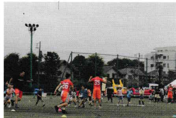
しっぽとりゲーム

鹿島柴崎グラウンドにおいて第15回目となる“ファンフェスタ”がおこなわれました。