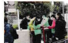
簡易トイレの組み立て