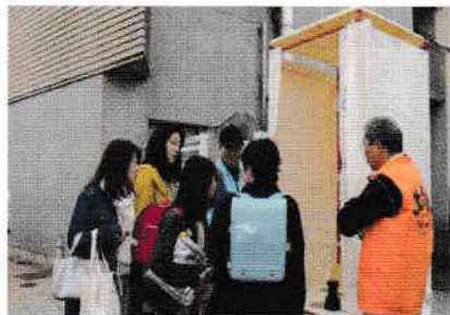
簡易トイレの説明を受ける小学生と保護者の方々