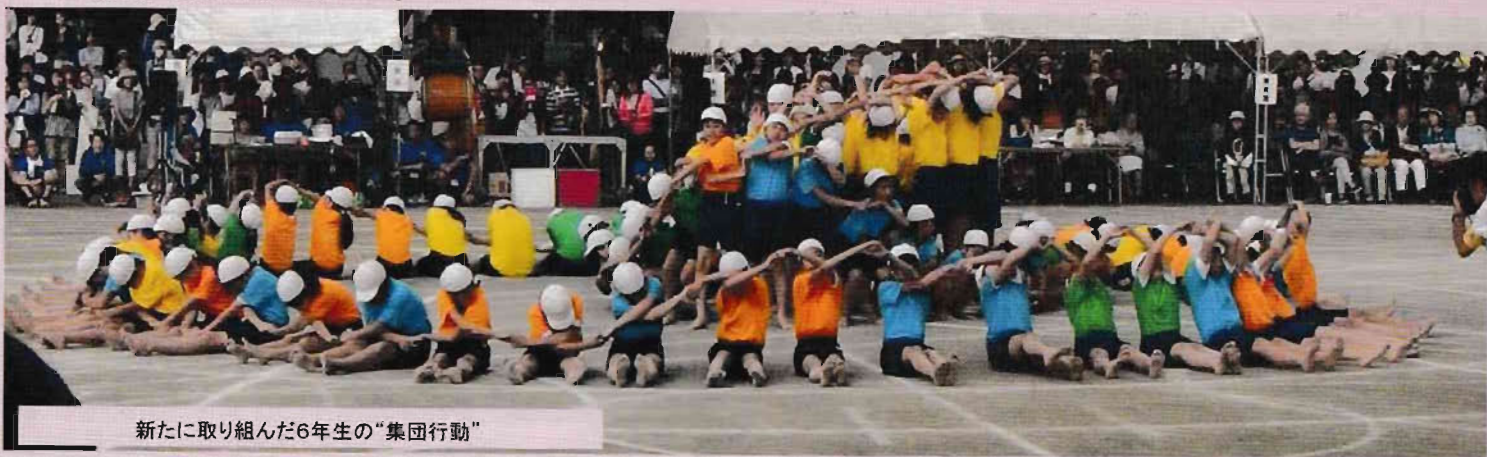
新たに取り組んだ6年生の「集団行動」

第一小学校の運動会が5月27日(土)に開催されました。スローガンの「一致団結 みんなが主役 優勝めざして熱くなれ!」のとおり全学年が全力で走り、元気に演技を披露しました。特に、6年生は「TRY~冒険者たち~」の演目で初めての「集団行動」に取り組みました。結果は僅差で紅組の優勝でしたが、一人ひとりの力を十分に発揮した心に残る運動会となりました。