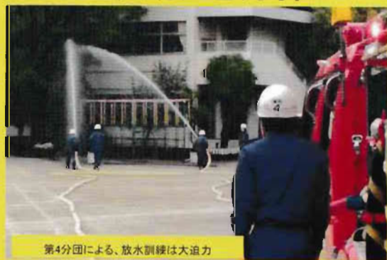
第4分団による、放水訓練は大迫力

ご協力いただいたみなさま、ご参加をいただいた多くのみなさまに、お礼申し上げます。