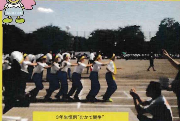
3年生恒例「むかへ競争」