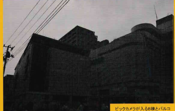
ビックカメラが入るB棟とバルコ

調布駅上に建設中の駅ビルの名称「トリエ京王調布」とシネマコンプレックス、家電量販店など72のテナントが発表されました。9月開業を予定しているとのこと。工事の覆いがかすれビルの様子が見えるようになりましたが、窓もなく強固な要塞の様です。「進撃の巨人のようだ」との声も聞こえますが、これも駅周辺の大きな変化でしょうか? (2017年6月27日撮影)