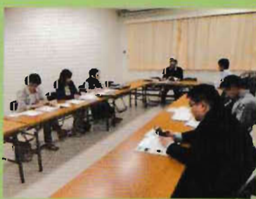
6月14日の役員会の様子

6月14日(水)今年度第一回役員会を、7月10日(月)に第一回運営委員会を、第一小学校せせらぎルームにて開催しました。7月発行のいっしょにネ!、夏休みラジオ体操や第一小校庭で開催される夏祭りへの協力などの活動について、報告と話し合いを行いました。