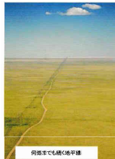
何処までも続く地平線

このように、モンゴルは大自然に恵まれています。また、一番有名なのは、モンゴルの夜の星空です。とても綺麗です。まるで手で取れるように綺麗で明らかに見えるので、世界の様々なところからモンゴルの星空を観に来る観光客が数多くいます。