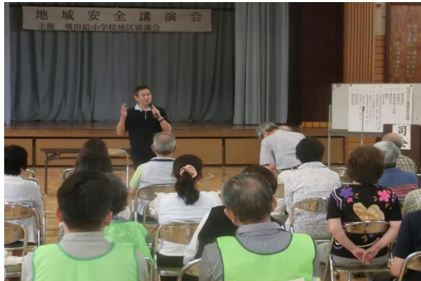
特殊詐欺について