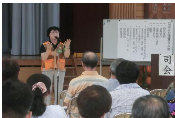
痴漢対策について