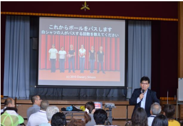
事故の当事者にならないためには