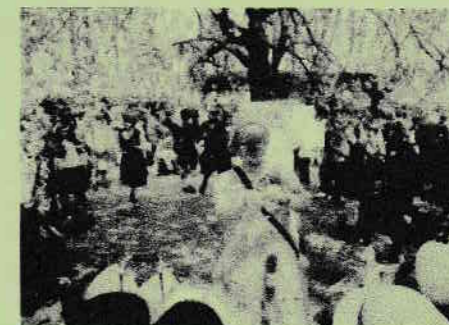
昨年のバルンアートの様子

模擬店・アトラクション(好評のバルンアートもあります)など準備してお待ちしております。御家族、御近所お誘い合わせおいで下さい。