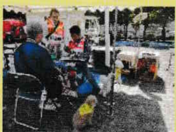
⑪ペット避難所体験