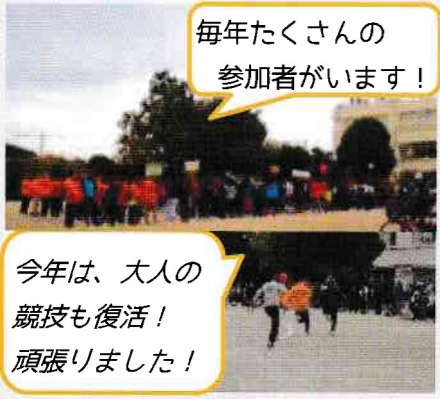
毎年たくさんの参加者がいます！

11月4日工事が終わった校庭でロードレース・ミニ運動会が行われました。学校の周囲を走るロードレースは地域の協力無しにはできません。みんなで子どもたちを応援し見守ります。競技はパン食い競争や宝探しなどうれしい賞品付きで、みんな大喜びでした。