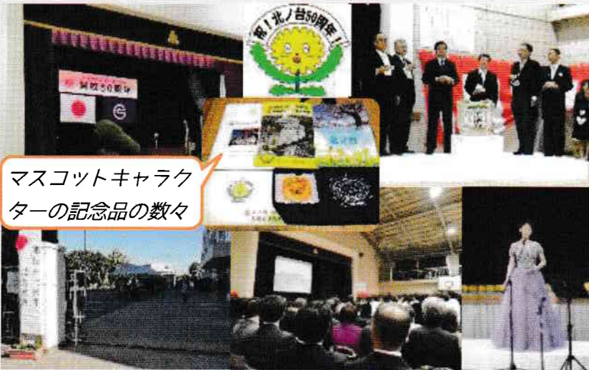
マスコットキャラクターの記念品の数々

11月2日(金) 澄み渡った秋晴れの元、北ノ台小学校開校 50 周年記念式典・祝賀会が多数のご来賓を迎え行われました。式典は厳粛に、映像と併せた 6 年生の合唱と呼びかけは感動でした。