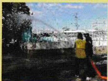
⑩ポンプ車放水訓練