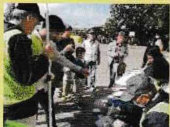
⑦アルファ米試食体験