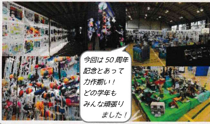
今回は 50 周年記念とあって力作揃い！どの学年もみんな頑張りました！

11月17日(土)・18日(日)の2日間、北ノ台小学校の展覧会が開催されました。入口の校門から会場まで道案内はカラフルなペットボトル。渡り廊下も自然光を活かし、高い天井の空間に魚が泳いでいたり、高学年は細かく丁寧なミニチュアを制作し自分より大きな絵を描くなど、何時間でも見ていたい、そんな素晴らしい展覧会でした。