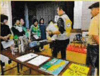
⑤避難所知識・防災用品