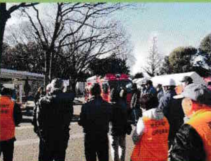
自衛隊や獣医師も参加しています