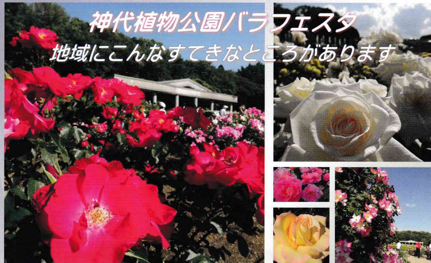
神代植物公園ばら園