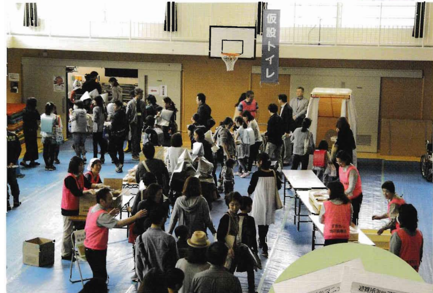
4月23日防災教育の日