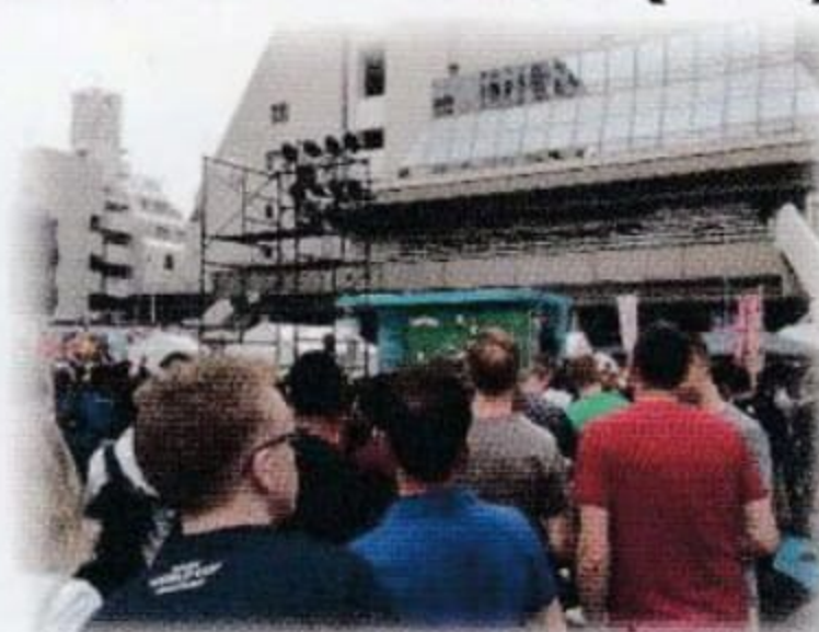
各国から応援に駆け付けた人々。

9月20日の開幕戦の快勝から大躍進中の日本!! 東京都内では、日比谷公園と調布駅前の2か所での開催とあって、ファンゾーンも大変な盛り上がりを見せています。