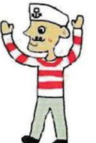
調布ヶ丘児童館のキャラクター「セーラーマン」

☆地域の人たちがおいしいごちそうや楽しいイベントを用意してお待ちしています。楽しい一日を過ごしましょう。 ☆10/10(木)より前売りチケットを先着300名で販売しています。お問い合わせは、調布ヶ丘児童館まで。Tel:042-485-3101