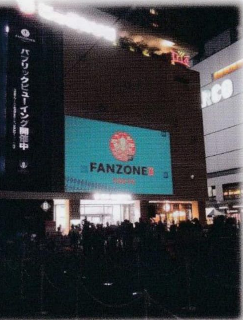
トJIB館壁面の巨大スクリーン。

まさに、「一生に一度の体験」まだという方はぜひのぞいてみてください。ファンゾーンは11月2日の決勝当日まで、毎週末開催されます。