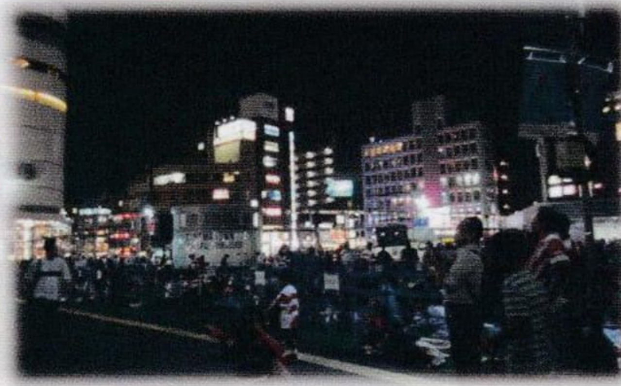
9月20日(金)日本vsロシアの開幕戦を見に詰めかけた人々。