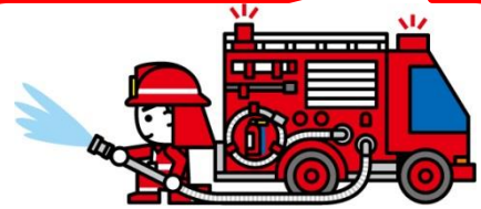
ポンプ車放水訓練

他にもいろいろ 体験ができます! 大人も子どもも お年寄りも みんな参加してね!