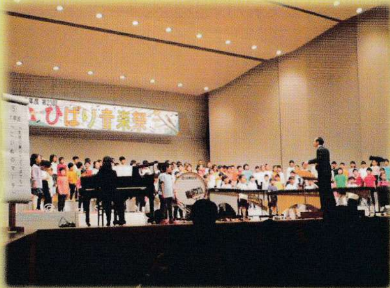
1年生「気球に乗ってどこまでも・こいぬのまーち」

3年に一回グリーンホールで開催されるひばり音楽祭。ステージ上は当日の冷たい雨を忘れるほどの明るい元気で溢れていました。