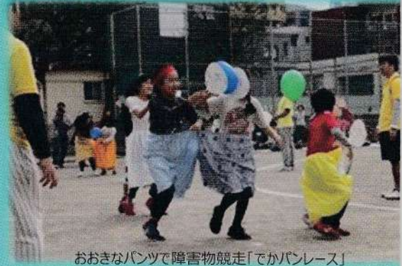
おおきなパンツで障害物競走「でかパンレース」

地域のお店からの寄贈の沢山の賞品をいただき、子ども達も大活躍。優勝は白組(調布ヶ丘1・3地区)で、優勝カップと賞品のサツマイモをいただきました。