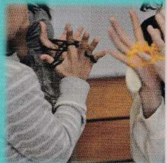
あやとり 上手にできました

1月29日大雨が上がり、春の気温暖かな中で第一小学校恒例の1年生による「昔遊び」が行われ、地域でお手伝いに参加した。125名が11の遊びにトライした。めんこ・竹馬・あやとり・コマ回し……竹トンぼ……。本気で挑戦する姿は晴れ晴れしくもあった。声を張り上げ、竹とんぼが飛ばせた時の満面の喜び顔は宝石のごとく煌びやかでもあった。