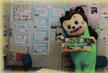
子どもの権利条約を子ども達にわかりやすく展示

12月14日(土) 12時からパン、焼き菓子、木工作品などの9模擬店が開店。ステージは、今年第一小学校吹奏楽クラブも参加し、桐朋学園短期大学のフルートカルテット、けやきの森学園の和太鼓、第五中のダンス部、第七中の合唱部、調布南高校のダンス部その他の地域からの参加と昨年より賑やかで楽しい舞台になり、観客も一緒になって歌い踊り、拍手大喝采でした。