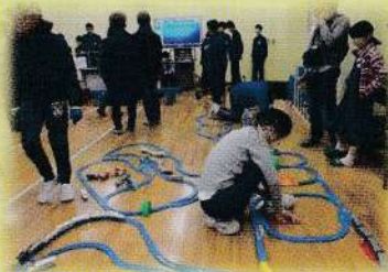
床いっぱい敷かれたブラレール