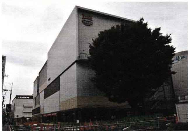
西調布側から 3館を望む

9月29日(金)調布駅の商業施設「Trié 調布」3館が開業しました。写真中央のけやきの大木は、唯一残された木です。その名も「けやきひろば」と名付けられた映画館西側の広場から線路の跡地「てつみち」には箱型のベンチが多く置かれていて、木陰でコーヒーを楽しむ人や駆け回る子どもたちなどが集う憩いの新名所となりつつあります。