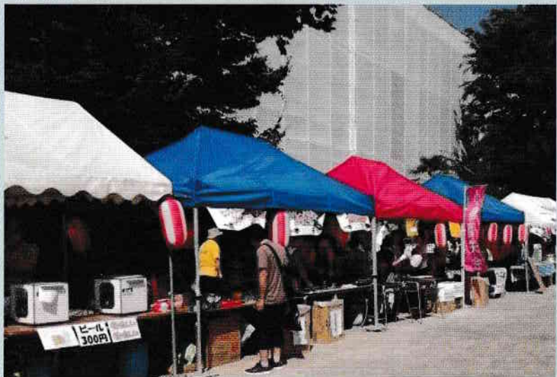
夏休み最初の土曜日は、とても良いお天気でした!!

7月22日(土)第一小学校校庭にて、内容豊かに、賑やかに開催されました。体育館では第一小吹奏楽クラブ、調布中OBによるさくらウインドオーケストラ吹奏楽部の演奏など多様なライブ演奏が行われ、中でも校長先生率いるティーチャーズバンドは、先生方のすばらしい演奏や絶妙なトークに、会場は大いに盛り上がりました。地域の緒団体の出すたくさんのお店は、どこも大盛況でした。いっしょうふれあいネットワークでも、フランクフルト、冷やしきゅうり、ソースせんべいのお店で参加し、多くの方にご来場いただき、早々に完売となりました。