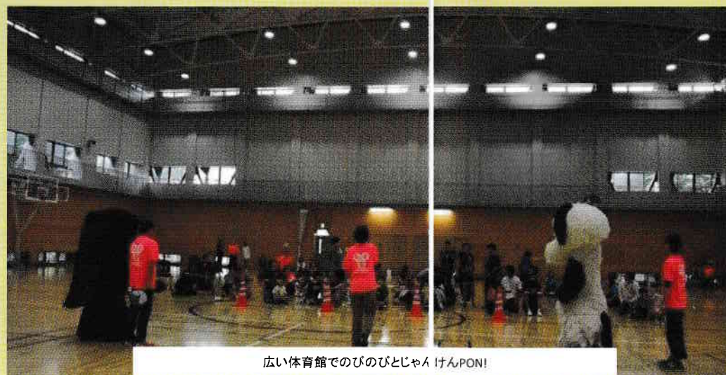
広い体育館でのびのびとじゃんけんPON!

9月30日(土)午後、リソースネット企画で調布特別支援学校の子どもたち、家族、サポートさんたちが集いました。電通大生のジャクリングの見事な妙技と、お手玉を使って体験もしました。ダンスとゲームは、OBお母さんのレインボーサークル。お楽しみは、どーもくんとワンワンくんとおしゃべりけんゲームです。ひろーい体育館で、大きな声を出し、全身のびのびした1日でした。