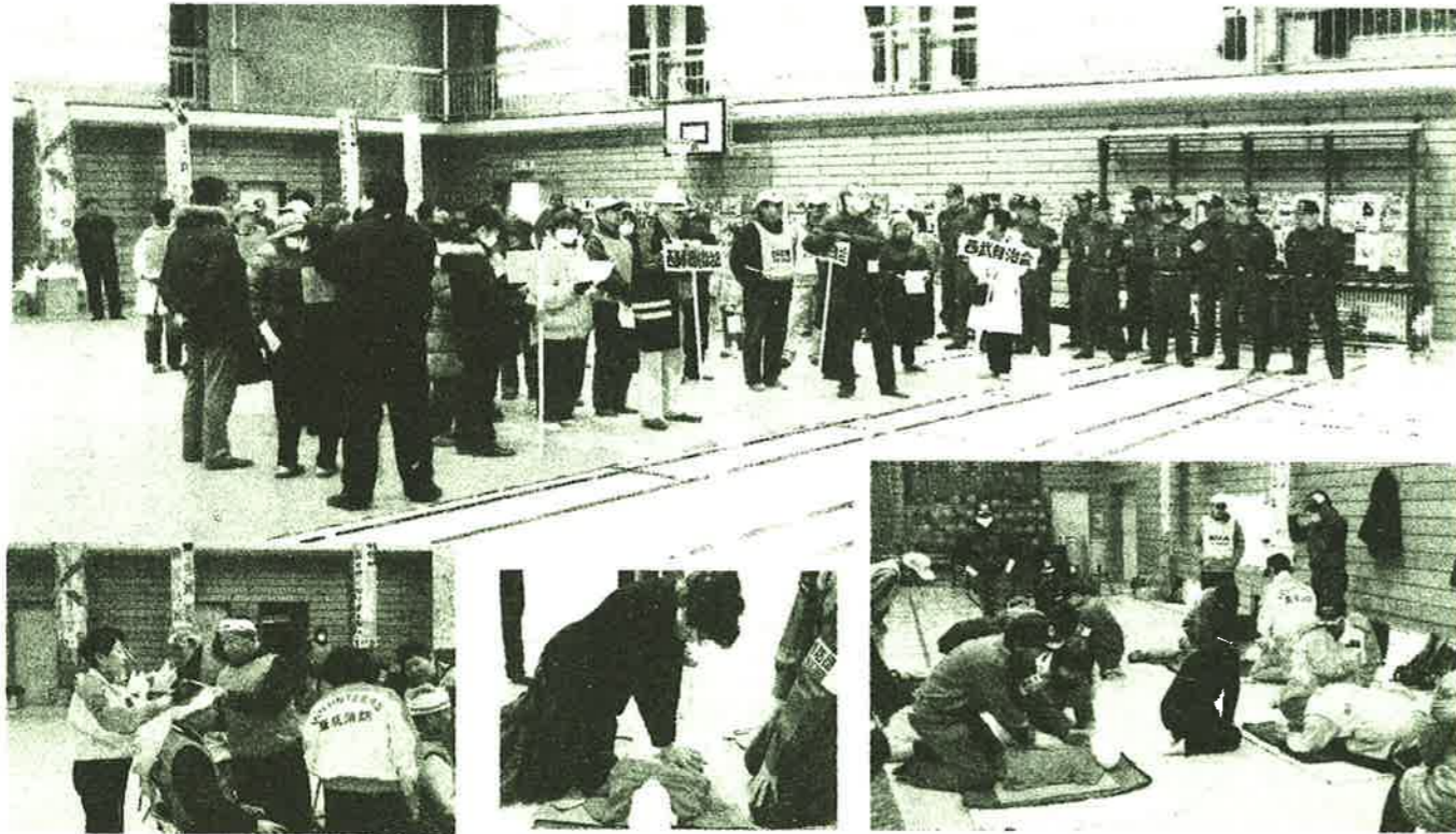
三角巾による応急手当