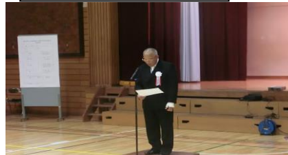
板橋実行委員長 挨拶