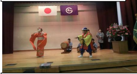
飛田給おはやし保存会