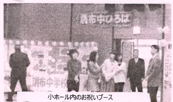
小ホール内のお祝いブース

の有志による「成人を祝う会」のお祝いブースや、健全育成のみなさんのパトロールなど、地域が一体となって新成人を祝い、温かく見守っていました。