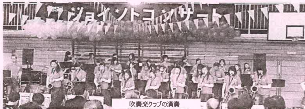
吹奏楽クラブの演奏