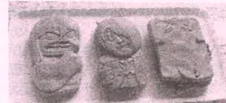
妖怪焼き 左から砂かけ婆、鬼太郎、ぬりかべ