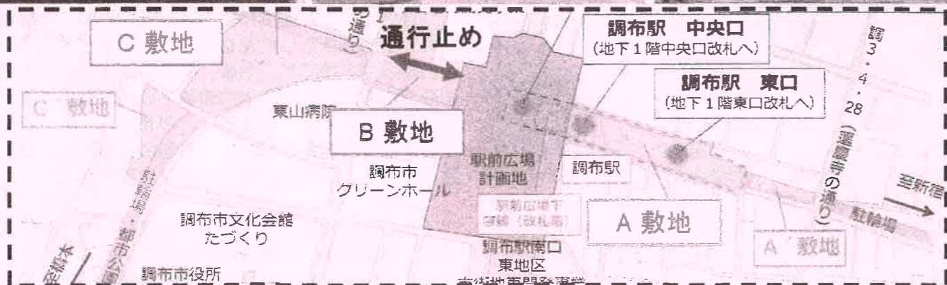
*上記の図は、説明会の配布資料より抜粋しています。現時点での計画であり、今後変更の可能性がります。

2月5日・6日に、京王電鉄による調布駅周辺開発計画・工事計画説明会が開催されました。いっしょうふれあいネットワークでは、説明会に参加しましたのでその内容をお伝えします。