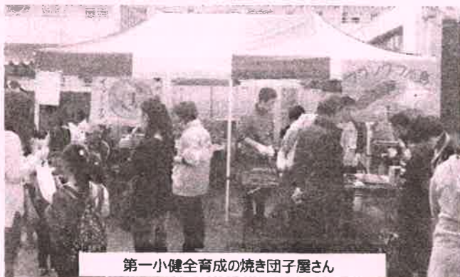
第一小健全育成の焼き団子屋さん

11月1日(日)調布ヶ丘児童館の児童館まつりが行われました。第一小と八雲台小の健全育成、民生児童委員、学童クラブ父母など地域の大人のお店、児童館メンバーや学童クラブの子どもたちによるお店。ステージでもたくさんの出し物が出され楽しい一日を過ごしました。