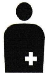
オストメイト用設備 / オストメイト

オストメイトとは、がんなどで人工肛門・人口膀胱を造設している排泄機能に障害のある人のことをいいます。このマークはオストメイトの為の設備(オストメイト対応のトイレ)があること及びオストメイトであることを表しています。