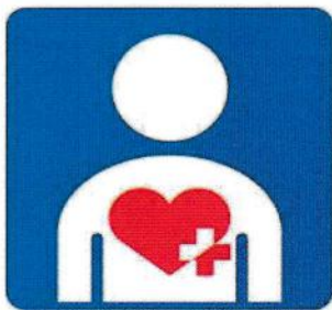
ハート・プラスマーク