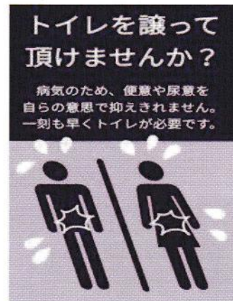
トイレ優先カード