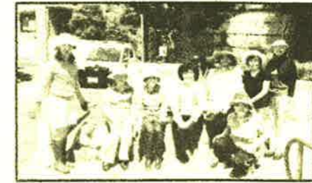
「けやき会」の皆様と花植え

皆様、どうぞ通りかかった折にはお花たちをめでて頂き、水やりなどご協力をお願いします。「花植え隊」はいつでも募集中です。よろしくお願い致します。