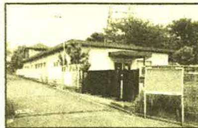
旧児童館学童クラブ上ノ原分室

上ノ原小学校北側にある、調布市立つつじヶ丘児童館学童クラブ上ノ原分室(柴崎2-27-25)は、平成25年4月まで学童クラブとして利用されていましたが、平成27年度から市内で18番目のコミュニティ施設「ふれあいの家」としてリニューアルオープンすることとなりました。