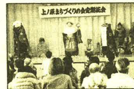
祝い囃子が披露されました