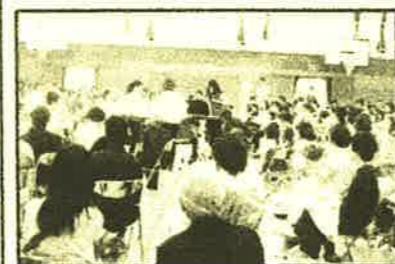
桐朋学園大学 (打楽器科)

東日本大会にも出場し大活躍の神代中学校合唱部と、調布音楽祭にも参加している桐朋学園大学のパーカッショングループの演奏で、地域の皆様方も300名近く参加され、楽しい時を過ごすことができました。