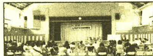
設立10周年を祝い市長祝辞も頂きました

最近の激しい気象変化は、各地に多くの被害をもたらしています。普段から両隣声かけあって、ひとりひとりわがまちづくりを考えましょう。