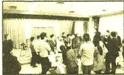
パトロールの方々の紹介

市役所、警察署、学校関係などの皆様にも参加いただきました。普段互いに話す機会の少ないこともあり、飲み物片手に歓談し合う様子があちこちで見られました。