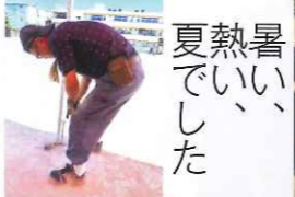
夏熱暑でいい、した