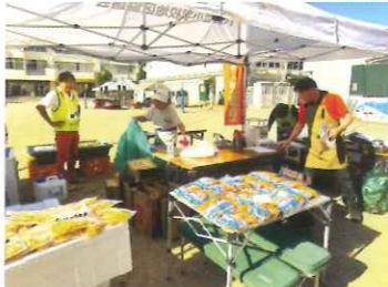
祭りのあとのゴミ拾い