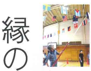
卒業生も手伝ってくれました