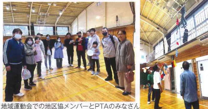
地域運動会での地区協メンバーとPTAのみなさん