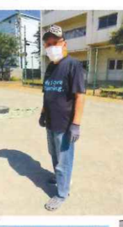
次に使う団体のために