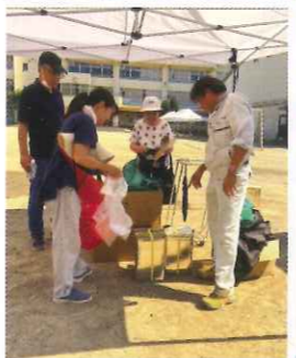
ナゲット揚げた油の後始末