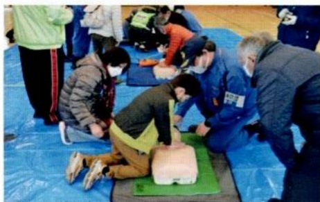
AED訓練 心臓マッサージ