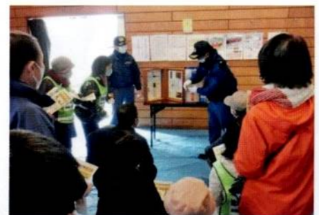
家具等転倒防止対策