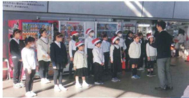
飛田給小学校合唱部