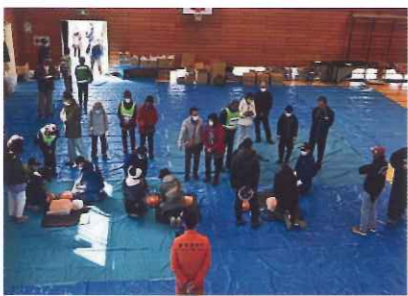
救急搬出、心臓マッサージ、AED訓練