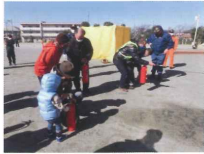
初期消火訓練 119番通報、消火器による初期消火