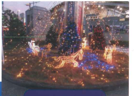
新しいモニュメントを追加しました