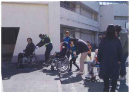
車椅子避難体験 安全な避難方法を体験