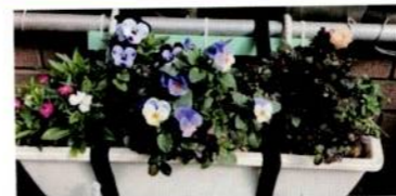
つつじヶ丘駅 トイレプラン ター管理