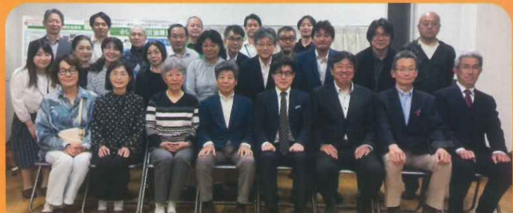
令和7年度かしの地区協議会運営委員