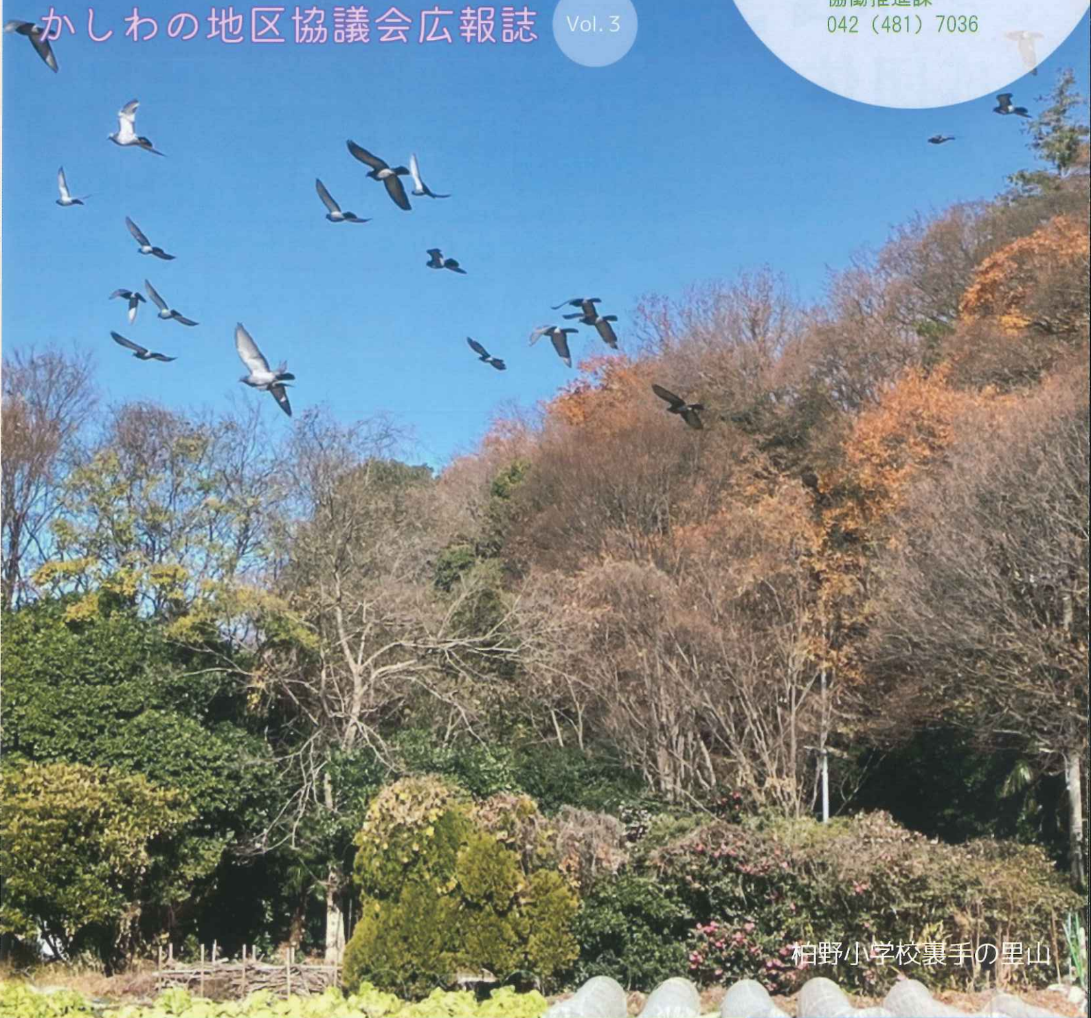
柏野小学校裏手の里山