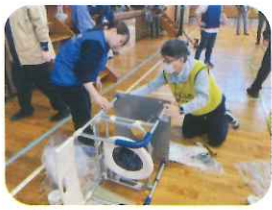
トイレの組み立て