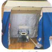
テントを建てて トイレ完成