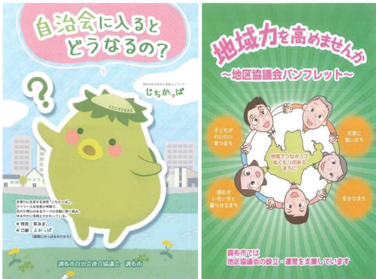
<調布市のホームページから>

調布市での地区協や自治会については市のホームページに紹介されていますので、ご参照ください。