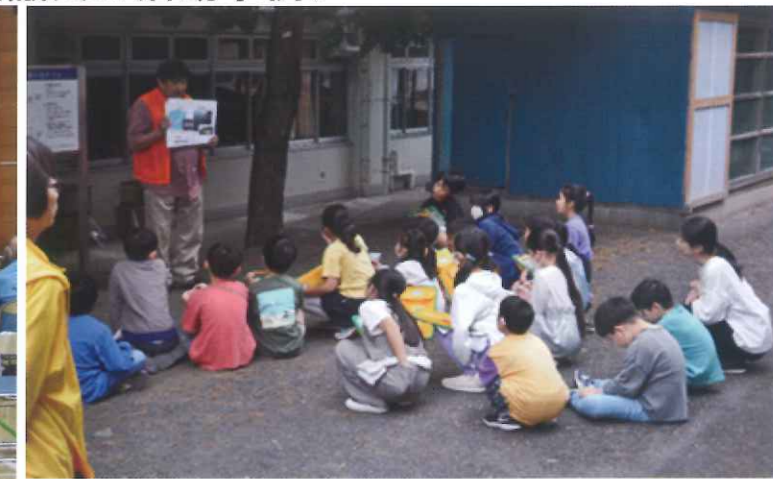
防災教育の日の支援