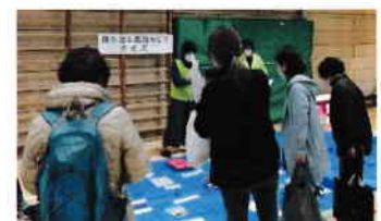
持ち出し品なあに？クイズに挑戦