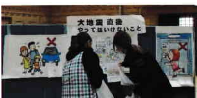
大地震後やってはいけないこと