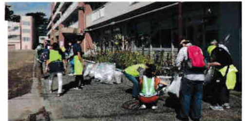
ゴミ分別も手際良く