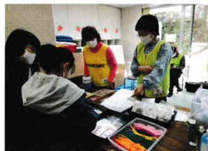
サシェの作成案内とキット配布が好評