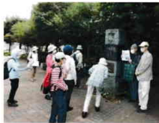
明大グランドが昔ありました （深大寺レジデンスにて）