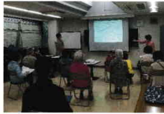
まずは講義で概要を学習

地域の皆さんと交流しながら楽しく地元を知る企画、今後もぜひご期待下さい。 （広報部・事務局）