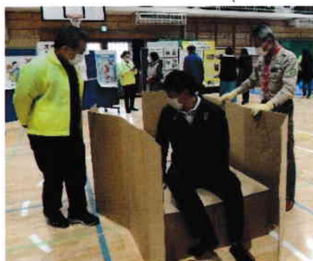
段ボールベッド体験