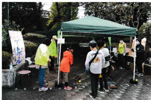
なんちゃってゲームだが意外とむずかしい