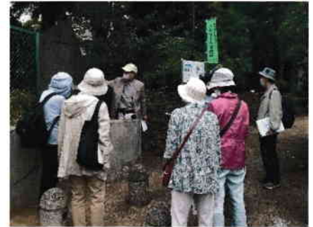
公民館前坂道「善並坂」の説明