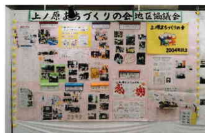
当会の活動紹介の展示

まちづくりの会では「なんちゃってゲートボール」を、その他団体が「射的」、「上ノ原かるた」、カードゲーム「十王坂の審理」スタンプラリーを担当し、秋晴れの日、140名を超える子どもさん方に楽しんでいただきました。 (ふれあい交流部)