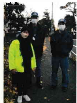
市担当課との合同パトロール