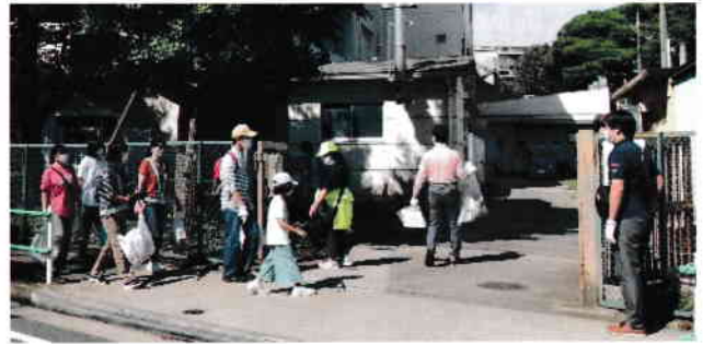
ゴミを拾いながら上ノ原小学校到着

また、環境美化部では地域文化祭の飾り付けの一環で公民館の花壇にお花を植えさせていただいたり、地域の 2 ヶ所の宮ノ前児童遊園、けやき児童遊園の花壇へお花を植えたりという活動もしています。 (環境美化部)