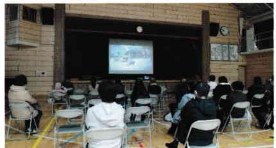
被害を映像で体感