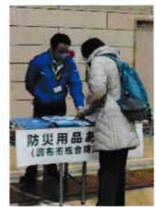
防災用品あれこれ