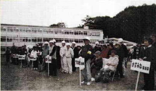
第1回地域防災訓練 若葉小学校区：平成20年