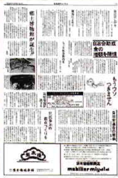
自治連協広報紙 - 中面