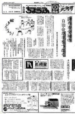
自治連協広報紙 - 創刊号