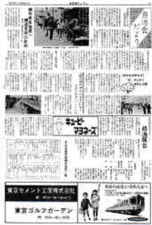
広告の多い広報紙

創刊から第28号までが図書館資料の中で見つかったが、いくつか特徴的な点は①みんなであつながら②町を良くしよう第二のふるさとづくり③要望書・陳情書を矢継ぎ早に発信したこと等が顕著である。さらに紙面で目を引くのが多くの広告を得ていること、各号平均14社・計334社からの協力を得ている。この貴重な広報紙はすべて協力を頂いた広告費で賄われていた。市報とは違った往時がしのばれ、自治連協の思いとパワーを垣間見ることが出来る。(記念誌には歴史資料として創刊号から28号の縮刷版を収録予定)