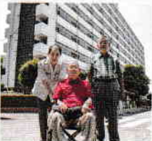
くすのきアパート3号棟

いずれは来るであろう大地震、そのとき停電、断水と長期間になれば、築40年の居住者の多くは高齢者、10階建のアパート等に生活物資などをどう上げるか考えていたときに、調布市の防災課より助成金の書類が届きました。内容は、費用の申請をすることで助成金が出るのとこのこと。このチャンスを利用して防災に備えたいと、発電機や蓄電ウインチなどを考え、ネット検索やカタログを見ながら計画しているところです。