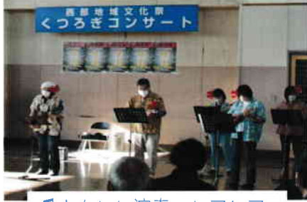
♪ウクレレ演奏 レアレア