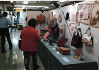
※ミレザークラフト