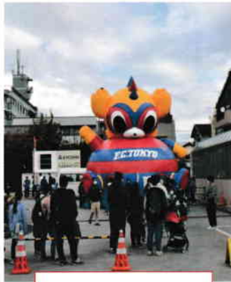
ドロンパふわふわ