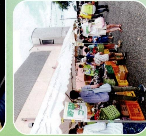
ふれあい朝市(深大寺保育園)

今年度は感染予防対策をしっかりととして、「北ノ台ふれあいサロン」も再開することができました。交流グループからできた「ピンポンクラブ」も多世代交流の事業として活動を広げています。