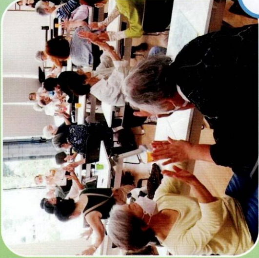
ふれあいサロン (ランチ調布交流プラザ他)