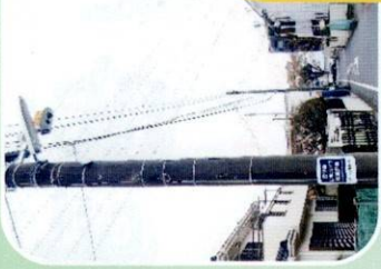
山野公園前 防犯カメラ