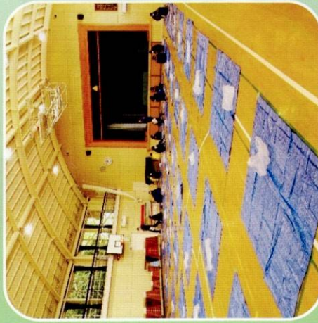
防災教育の日 避難所開設訓練