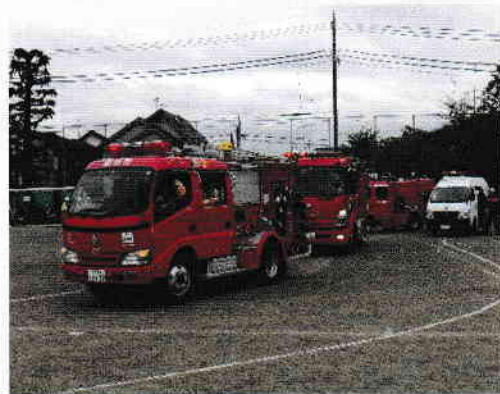
第三小学校合同防災訓練で先陣を切って消火活動に駆けつける上石原第2分団の消防ポンプ車

是非、消防団でかけがえのない仲間をつくり、仲間達と一緒に家族やまちの安全を担ってみませんか。