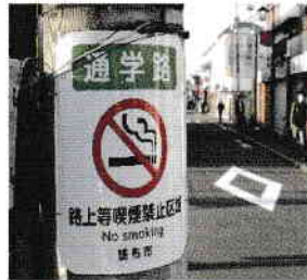
駅の周辺は路上喫煙が禁止されています。