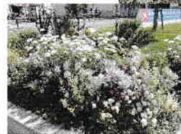
花の手入れをする花いっぱいボランティアの皆さん