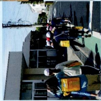
子供たちのために 様々な見守りや 協力をしています。

現在、調布市内の全ての公立小中学校に、地域学校協働本部があります。活動はそれぞれの学校で異なります。北ノ台小学校の地域学校協働本部では、まだ小学生生活に慣れない1年生の見守りや授業・活動の補助をしています。また校外学習の付き添いや、学校と連携して活動を進めています。随時、ボランティアも募集しています！