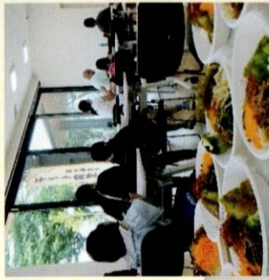
親子一緒に おいしいランチ！ 遊びコーナーもあって 楽しいよ！

コロナも少し落ち着き、5類になりました。「子ども食堂・深大寺東町」では、食事の提供を始めています。今年度、奇数月はブランチ調布1階のふじみ交流プラザで開催しています。今回は、ギターの演奏を聞きながらピビンバを食べ、別の部屋では射的や輪投げなどの遊びコーナーもあって盛り沢山の内容でした。