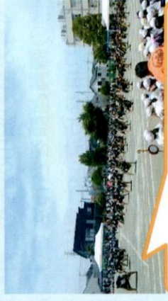
6年生の「北ノソーラン」！

5月27日(土)北ノ台小学校のスポーツフェスティバルが行われました。天候に恵まれ、全学年が一同に揃って開催されました。低学年はテントの席で、迫力のある高学年の競技や演技を鑑賞しました。3年ぶりに制限のない多くの来場者や保護者で学校がとても明るく元気に賑わいました。