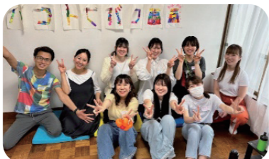
学生ボランティアの声