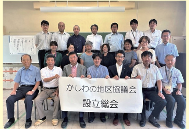
※かしの地区協議会設立総会にて (令和5年7月23日撮影)