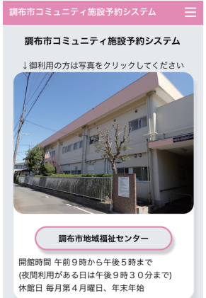
予約システムトップページ画像