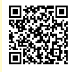
ちょみっと かしの地区協議会ページ