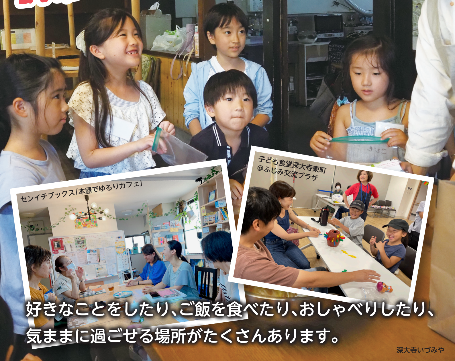
セイイチブックス「本屋でゆるりカフェ」