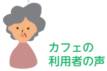
カフェの利用者の声