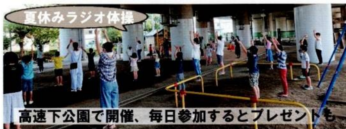
高速下公園で開催、毎日参加するとプレゼントも