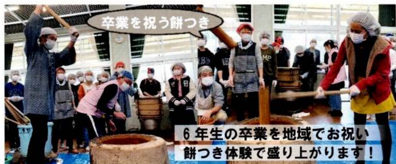
卒業を祝う餅つき