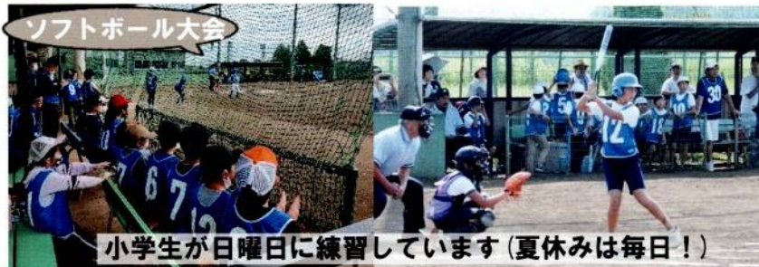
小学生が日曜日に練習しています(夏休みは毎日!)