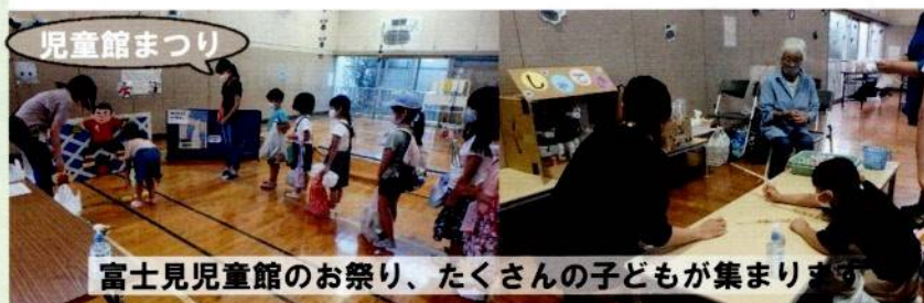
富士見児童館のお祭り、たくさんの子どもが集まります

ふじみパトロール隊 登下校見守り、わんわんパトロール、青パトの巡回などを実施し、地域の安全を守る活動しています 健全育成推進石原地区委員会(けんぜん)ソフトボールや振舞い、6年生の卒業をお祝いする行事などを行っています