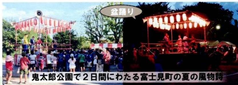
鬼太郎公園で2日間にわたる富士見町の夏の風物詩