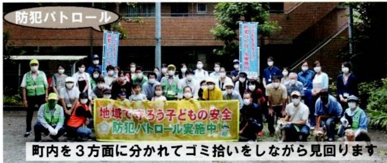
町内を3方面に分かれてゴミ拾いをしながら見回ります