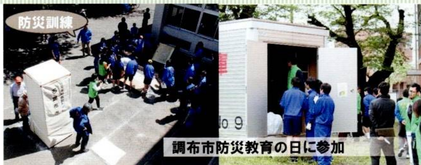
調布市防災教育の日に参加