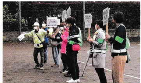
罰則ありのプラカード、注目されました