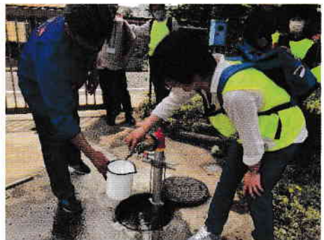
スタンドパイプによる応急給水訓練