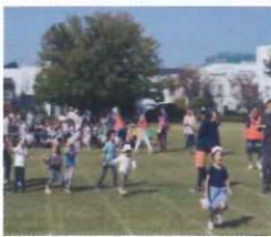
パン食い競争(幼児)

今年4年ぶりに神輿・山車の渡御が執り行われました。 本祭当日は、子供神輿・山車の担ぎ手の子供達、そして大人神輿の担ぎ手といっしょに多くの人が集まりました。夜には奉納踊りを行い一連の行事を終了しました。