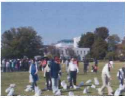
お宝ゲットレース(70才以上)