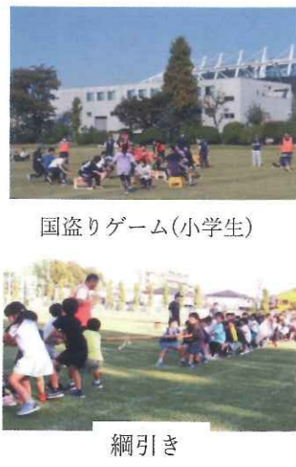
国盗りゲーム(小学生)

11月3日(金)文化の日、絶好の天候に恵まれ開催されました。 自治会会員の皆さん他、大勢の老若男女で賑わいました。 親子2人3脚、パン食い競争、年齢別リレー等沢山の競技を楽しみ、最後に男女別綱引きで締め括られました。