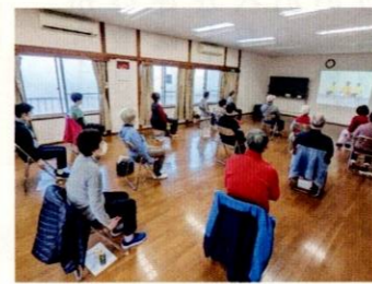
会場は布田南部自治会館2階

ハッピータウン主催のフレイル予防の「10筋トレーニング」の今年度は2月24日、3月24日です。いずれも10時～11時半、参加申込不要です。来年度は月2回の開催を予定しています。詳細はWEBサイトをご参照ください。