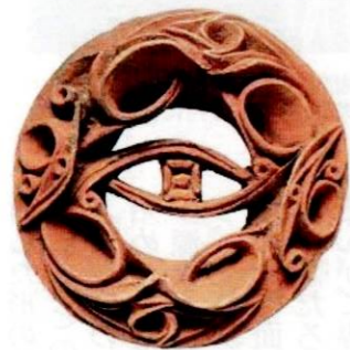
2500年前（縄文時代）の土星耳かざり 【国の重要文化財】