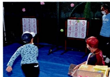
ストラックアウト

ムをやるうかと真剣に話 し合う姿が、何ともかわ いらしかった。 校門を入った体育館前 の広場には5つほどのテ ントが設置されて、千本 つりやストラックアウト などのゲームをすること ができ、景品がもらえる ゲームは1回百円、それ 以外は無料なので、それ ぞれに目を輝かせた子供 たちの行列ができ、運営 側の大人も中にはハロ ウインの仮装をしている 人もいて、双方とても楽 しそう。また、体育館の