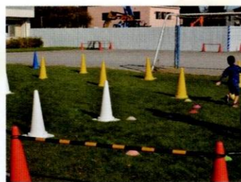
ドリブルタイムトライアル