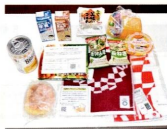
第13回（9月）配布の内容

コロナ禍でハッピー子ども食堂が開催できなくなり、その代替事業としてこれまで15回実施しました。申込募集は、WEB専用アプリで行います。当地区協のWEBサイトをご参照ください。