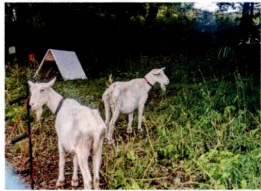
整備整備開始の先立ち、ヤギを使った エコ除草作業が10月に行われた

墳の中でも、布田6丁目の 狐塚古墳は東京都域でも最 大級の円墳と言われてお り、都の史跡にも指定され ている。狐塚古墳を始め市 内の古墳のほとんどは、立 川段丘の縁辺部（いわゆる ハケの上縁）に集中してい る。竪穴住居跡が見つかる 染地遺跡はハケ下に位置し ていることから、人々の日 常生活を見守るような所に 古墳を作ったのだろう。