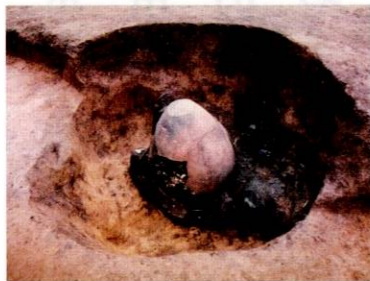
奈良時代の火葬墓