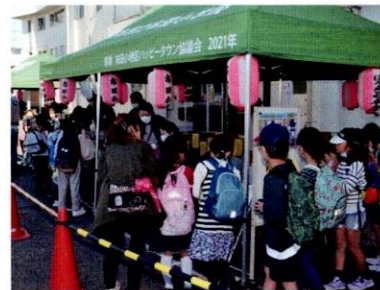
光るおもちゃに並ぶ子どもたち

ムをやるうかと真剣に話 し合う姿が、何ともかわ いらしかった。 校門を入った体育館前 の広場には5つほどのテ ントが設置されて、千本 つりやストラックアウト などのゲームをすること ができ、景品がもらえる ゲームは1回百円、それ 以外は無料なので、それ ぞれに目を輝かせた子供 たちの行列ができ、運営 側の大人も中にはハロ ウインの仮装をしている 人もいて、双方とても楽 しそう。また、体育館の