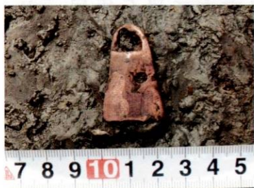
ほぼ完全な形で発掘されたミニ銅鐸 【お隣の染地遺跡発掘】